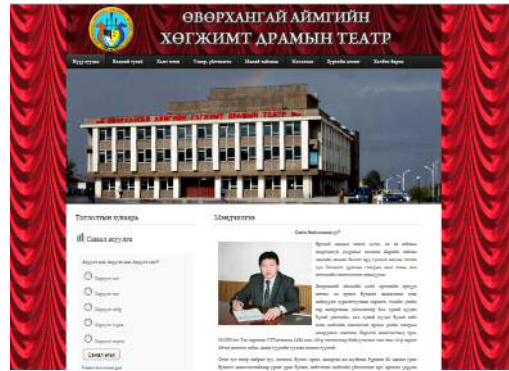
Хөгжимт Драммын Театрын цахим хуудас