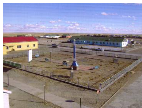
Баянгол сум тохижилтоороо шалгарч цэцэрлэгт хүрээлэн, зам засвар, нийтийн биеийн тамирын талбайг шинээр байгуулав.