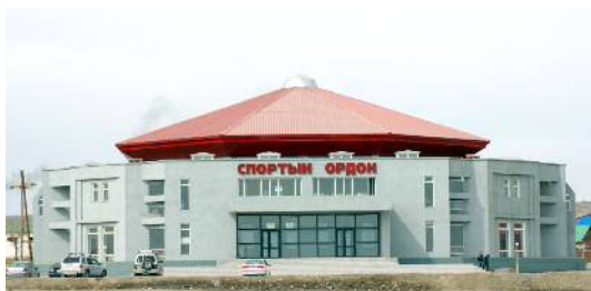
1.6 тэрбум төгрөгийн өртөг бүхий 640 хүний суудалтай Спортын ордонг шинээр ашиглалтанд оруулав.

Арвайхээр хотод улсын болон орон нутгийн төсвөөс 21.8 тэр бум орчим төгрөгийн хөрөнгө оруулалт хийгдэж 640 хүний суудалтай Спортын ордныг ашиглалтад оруулж, Хүүхэд, залуучуудын парк, цэцэрлэгт хүрээлэн, 150 ортой хүүхдийн цэцэрлэг, автозам, зочид буудал зэргийг шинээр байгуулж, мод, зүлэг суулгах ажлыг мэргэжлийн байгууллага Улаанбаатар хотын “Цэцэрлэгжилт” компаниар