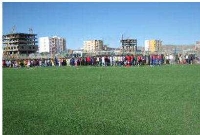
Хөл бөмбөгийн талбайг ашиглалтанд хүлээн авснаар хүүхдүүд чөлөөт цагаа зөв боловсон өнгөрүүлж байна.