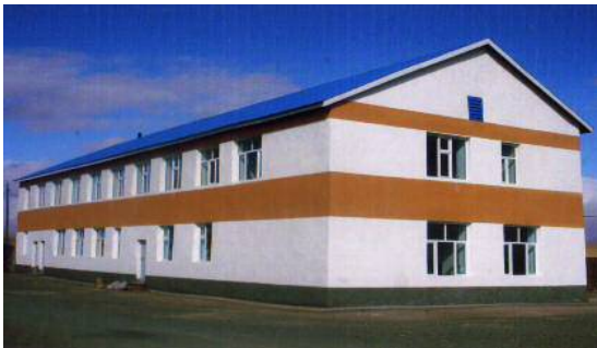
Уянга сумын “Бизнес хөгжлийн төв”-ийг шинээр бий болгов

Аймгийн ИТХ-аас 2010 оныг “Орчноо тохижуулах жил” болгон тусгай болзол зарлаж дүгнэв.