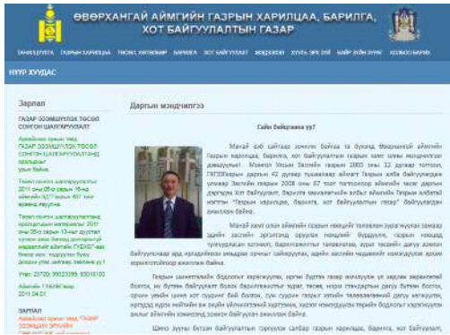
Аймгийн Газрын харилцаа, барилга, хот байгуулалтын газрын цахим хуудас