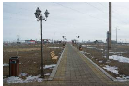
Занабазарын сэрэг дүр бүхий цэнгэлдэх хүрээлэнг 239 сая төгрөгөөр шинээр бий болгов.