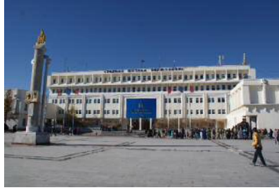
Аюуш баатрын төв талбайг боржин чулуугаар бүрж, Нутгийн удирдлагын ордныг 84 сая төгрөгөөр засварлав.