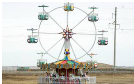
Хүүхэд, залуучуудын паркийг 110.0 сая төгрөгөөр барьж байна.

Аймгийн хүүхдийн урлагийн наадмыг зохион байгуулж, ХДТеатр, “Хүүхдийн төлөө хэлтэс”-ийн дэргэдэх “Ирмүүн” бүжгийн хамтлагийг өргөтгөн хүүхдийн “Суварга” чуулга байгуулан “Сэтгэлийн домог” дуулалт жүжиг бэлтгэн аймагтаа болон нийслэлд тоглолт зохиов. “Миний нутаг сайхан” сэдэвт сум сурталчлах урлаг, спортын өдөрлөгийг Арвайхээрт цувралаар зохион байгуулж байна.