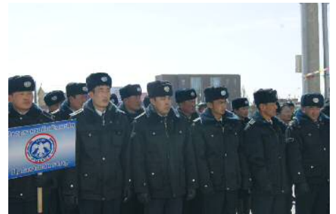
Бүх байгууллагууд иргэдэд нээлттэй байдлаар тайлагнадаг.

Б. Байгууллагын ил тод байдлыг сайжруулахад анхаарч аймаг, сум, багт төрийн байгууллагын “Нээлттэй хаалганы өдөр”-ийг тусгай хөтөлбөрөөр зохион байгуулан тайлан тавьж, үйл ажиллагаа, үр дүнг хэвлэл, мэдээллээр өргөн сурталчлан, аймаг, сумын ЗДТГ, төрийн бүх байгууллагын үйл ажиллагаанд ХШҮ хийх, “Нээлттэй хаалга”-ны өдрийг зохион байгуулах үеэр иргэдээр