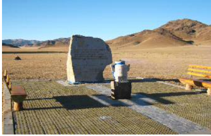
Баянхонгор аймгийн Түйн голд аймаг анх үүссэн газрыг тохижуулав.