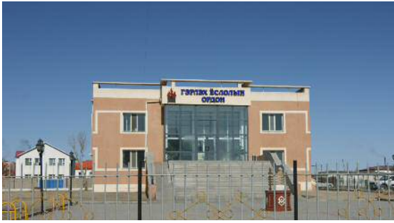
Гэр бүл хүний хөгжлийн төвийг ашиглалтанд оруулж хурим, сургалт, тэмдэглэлт өдрийг зохион байгуулж байна.

Арвайхээр хотод “Гэр бүл хүний хөгжлийн төв буюу Гэрлэх ёслолын ордонг шинээр ашиглалтанд оруулж, “Гэр бүл төлөвлөлт”, “Хүний хөгжил”, “Гэр бүл дахь хүүхдийн хүмүүжил” зэрэг сэдвүүдээр сургалт, “Гэр бүлийн өдөр”, залуу гэр бүл, олон жил хамтран амьдарсан гэр бүлүүдийн ёслол, хүүхдийн даахь үргээх ёслол, төрсөн өдөр болон тэмдэглэлт баярын өдрүүдийг зохион байгуулж байна.