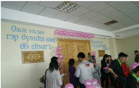
Олон улсын гэр бүлийн өдрийг тэмдэглэж, 21 тэнгэрлэг гэр бүлгийг шалгаруулав.

айлын орчин үеийн тохилог орон сууцуудыг ашиглалтанд оруулж, аймаг, сумдын төвд иргэд амины тохилог орон сууц олноор барьж амьдрах ая тухтай орчинг бүрдүүлж байна.