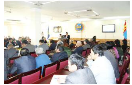
Сүлд танхимыг шинээр 40 гаруй сая төгрөгөөр тохижуулав.