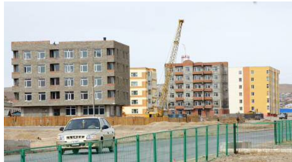
Шинээр баригдсан орон сууцны хороолол