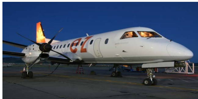
“Эзинис Эрвейз компани орон нутгийн нислэг үйлдэж байна. “

/Ил тод байдал –чанартай үйлчилгээ-2 сарын