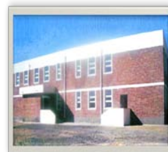
Мандал-Овоо сумын соёлын төв