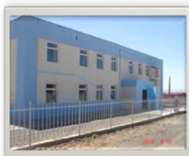
Хүрмэн сумын цэцэрлэг

6. Аймгийн хэмжээнд 20,0 гаруй тэрбум төгрөгийн хөрөнгө оруулалт, бүтээн байгуулалтын ажил хийгджээ. Хөрөнгө оруулалт төсөл арга хэмжээг эх үүсвэрээр нь авч үзвэл: Улсын төсвөөс 10,3 тэрбум, орон нутгийн төсвөөс 8,6 тэрбум, 1,7 тэрбум төгрөгийн гадаадын хөрөнгө оруулалтын ажлууд хийгдсэн байна.