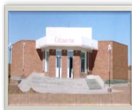
Цогт-Овоо сумын соёлын төв