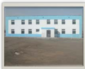
Ноён сумын цэцэрлэг