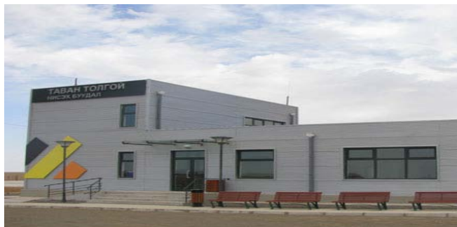
“Цогтцэций суман дахь “Тавантолгой” нисэх буудал”

7. Цогтцэций сумын “Цагаан овоо”, Гурвантэс сумын “Овоот”, Ханбогд сумын “Оюу толгой” зэрэг газруудад нисэх онгоцны буудал шинээр баригдаж, агаарын тээврийн вэмэгдсэнээр зорчигчдын тоо сард дунджаар 800-1200 болж, аймгийн хэмжээнд 4 газарт агаарын тээврийн үйлчилгээ үзүүлж, үйлчилгээ өргөжин хөгжлөө.